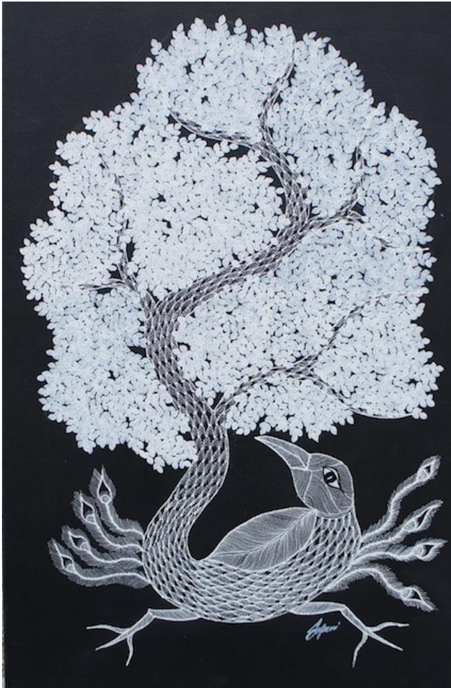
Japani Shyam, sans titre, 55x85 © Anders Hus

Tout jusqu'à ce carnaval Qui me fermera les dents Sur l'agame du chiendent !