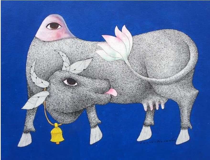
Venkat Shyam, Kamadhenu , 67x90 © Galerie Anders Hus